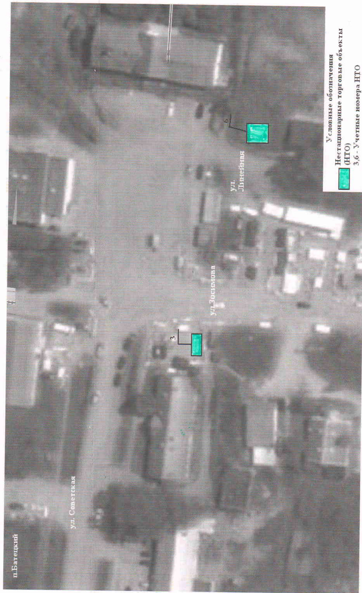
Схема размещения нестационарного торгового объекта (учетный номер места размещения НТО №3)